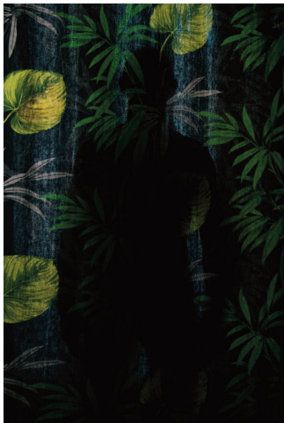
Paolo Topy, Exotica - 2014 106 X 160 cm - Courtesy Area35 ArtGallery - ©Paolo Topy